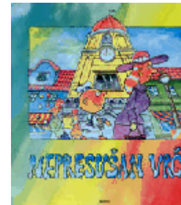
Đekić, Velid ; Mišković, Ivan: Nepresušni vrč