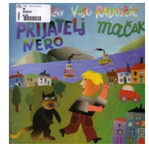
Radoičić, Vjekoslav Vojto: Prijatelj mačak Nero