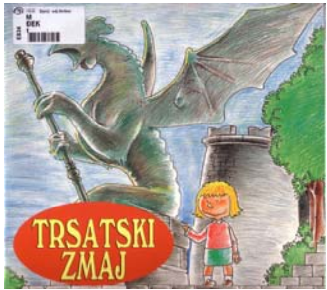
Đekić, Velid ; Mišković, Ivan: Trsatski zmaj