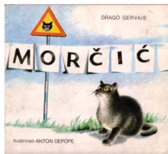
Gervais, Drago: Morčić

Škuro j' Samo lampica sveti. Va kuće se štorija poveda Od čuda beči (...)